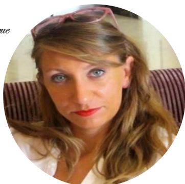
Gaia Events & Communication